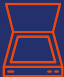
Scannen & Digitalisering