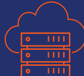
Opslag in de Cloud & Bedrijfscontinuïteit