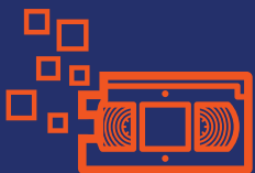
Tapes Herstellen & Converteren